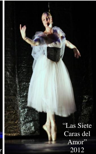
“Las Siete Caras del Amor” 2012